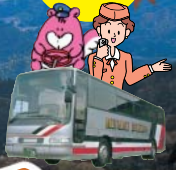
協力:南越後観光バス株式会社 写真はイメージです